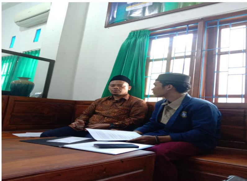
Peneliti dengan waka kurikulum MA Nurul Jadid