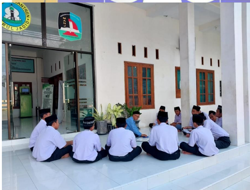
Proses pembelajaran di luar kelas