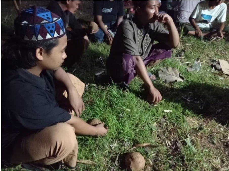
Foto : bantal mayat siap pakai