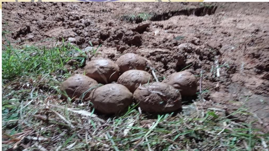
Gambar 6. Bantal mayat siap pakai