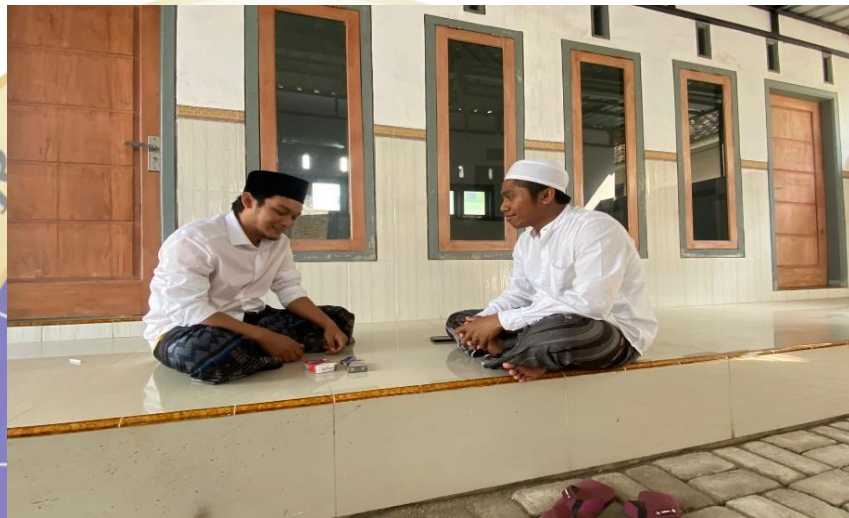
Gambar 1. Wawancara kepada masyarakat setempat

“saya tidak tahu akan hukumnya, namun pelaksanaan tradisi tersebut sudah lumrah ketika ada orang meninggal selalu diberi yang namanya bantal mayat. Untuk pembuatan bantal mayat tersebut biasa dilakukan oleh penggali kubur dan kemudian saat prosesi pemakaman bantal mayat tersebut dibagikan kepada beberapa masyarakat yang dianggap bisa dan fasih membaca surah Al-Qadr. Masalah dibacakan atau tidaknya saya tidak tahu, yang penting bantal mayat tersebut sudah dibagikan, akan tetapi harusnya dibacakan. tapi kalau ada kiai dipemakaman pasti kiai menyuruh untuk membacakan surah Al-Qadr.” 48