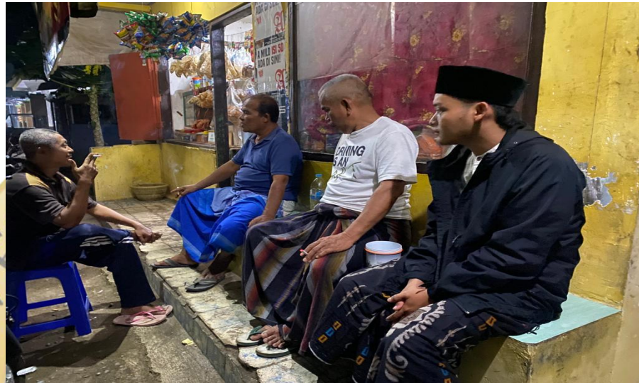
Gambar 7. Wawancara kepada masyarakat setempat

Mereka juga menyatakan tidak ada hitungan pasti didalam pembacaan surah Al-Qadr pada bantal mayat, paling sedikit satu kali dan paling banyak sebelas kali, namun yang sering dilakukan oleh masyarakat setempat tujuh kali. 54