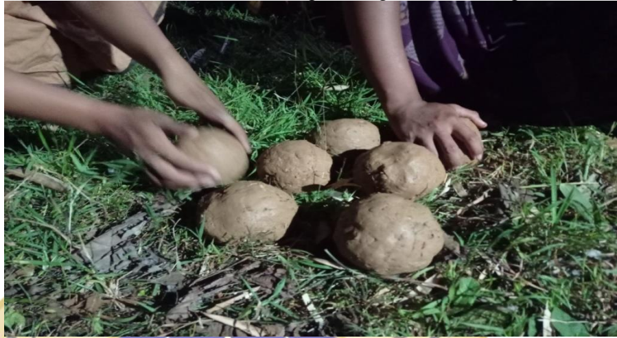
Gambar 4. Pembuatan bantal mayat

Posisi tanah di atas kubur dibuat agak tinggi membentuk gundukan.