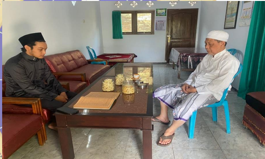
Gambar 3. Wawancara dengan tokoh masyarakat

sallallahu alaihi wa sallam tiga kali, bila mempunyai bagian siksa kubur, maka akan ditanggihkan selama empat puluh (40) tahun. Jika selama empat puluh (40) tahun sering dido'akan oleh ahli warisnya, maka bisa jadi siksaan yang ada akan dihapus karena do'a dari ahli waris. Sunnah lain yang menjadi tradisi di Desa Suren adalah membaca allahumma bi haqqi sayyidina muhammad wa 'ala ali sayyidina muhammad la tu'adzdzib hadal mayyit dibaca tiga kali, keterangan yang dikutip oleh KH. Hanafi mudzhar adalah kitab Fathu Mu'in . 50