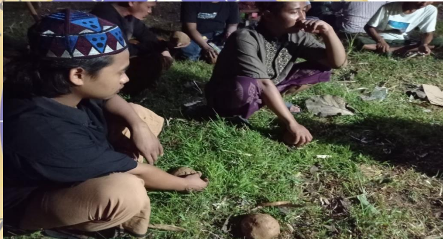
Gambar 5. Pembacaan surah Al-Qadr pada bantal mayat