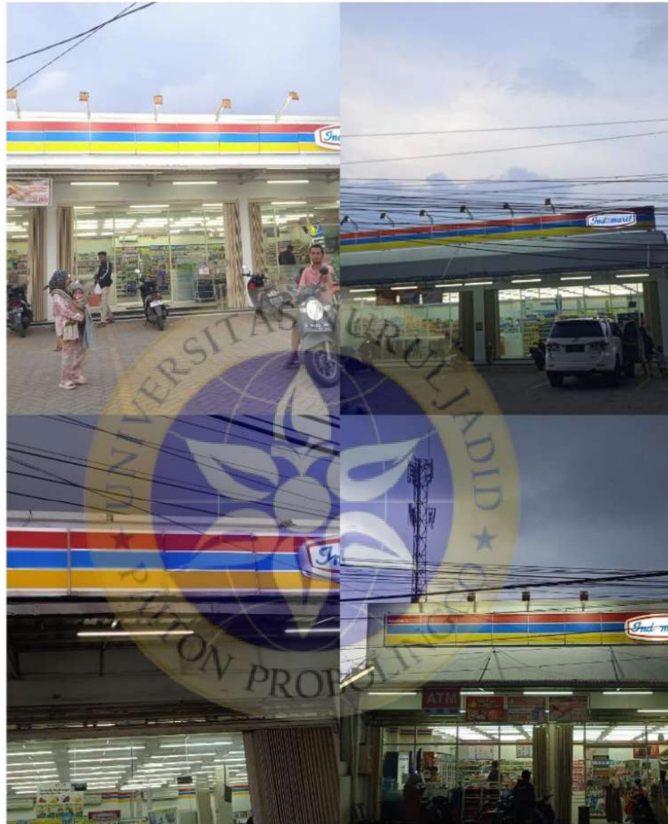
Lokasi Gerai Indomaret Di Berbagai Daerah Kecamatan Paiton