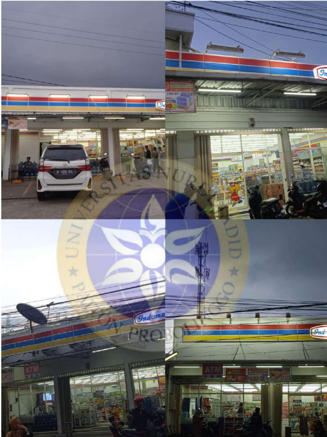
Lokasi Gerai Indomaret Di Berbagai Daerah Kecamatan Paiton