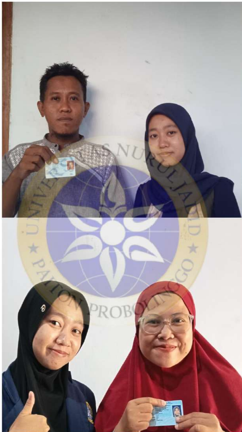
Wawancara Peneliti Dengan Informan