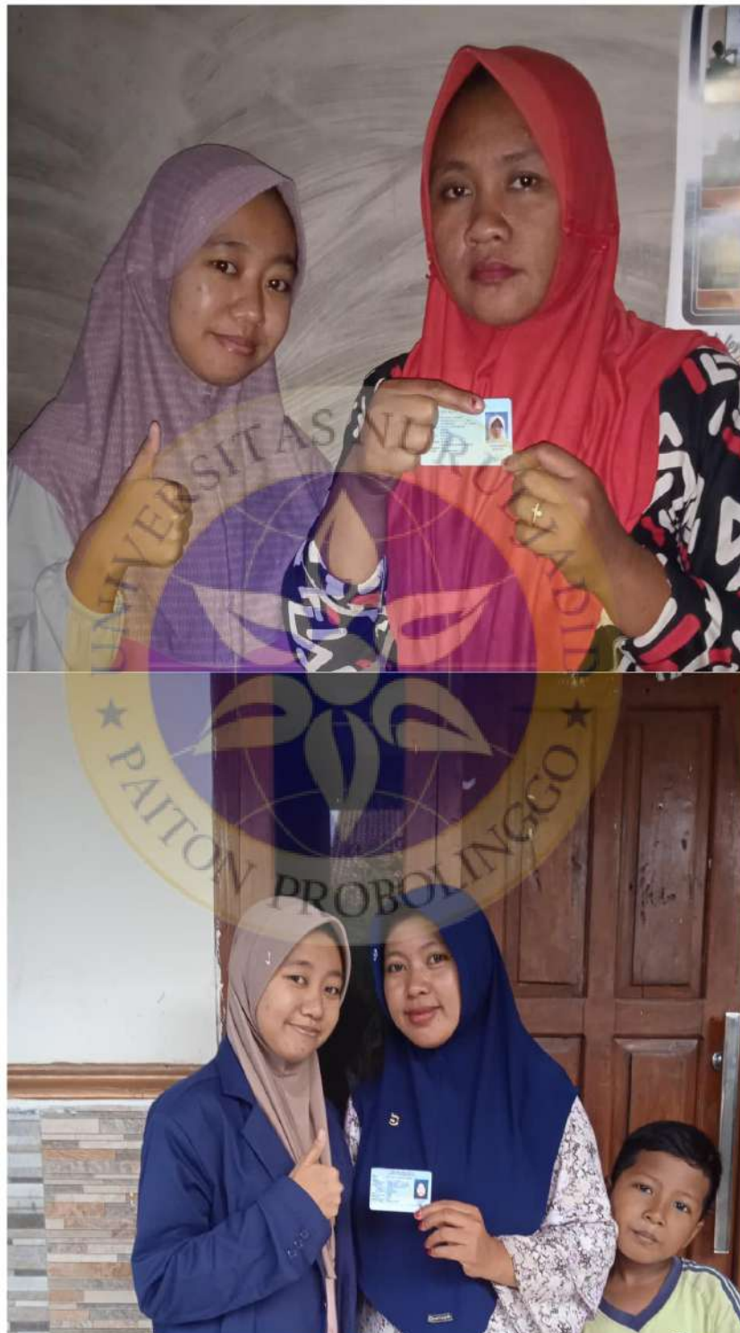
Wawancara Peneliti Dengan Informan