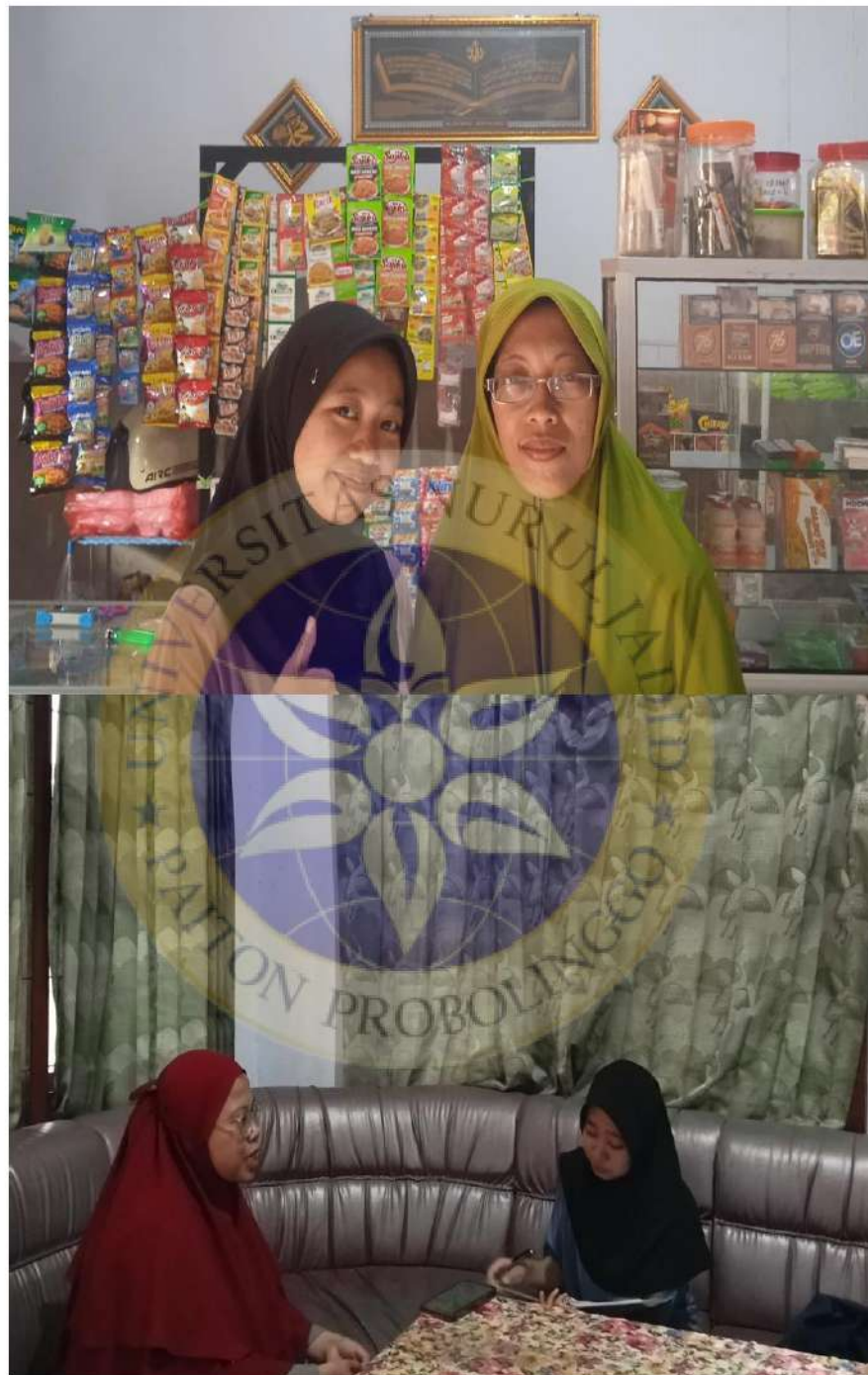
Wawancara Peneliti Dengan Informan