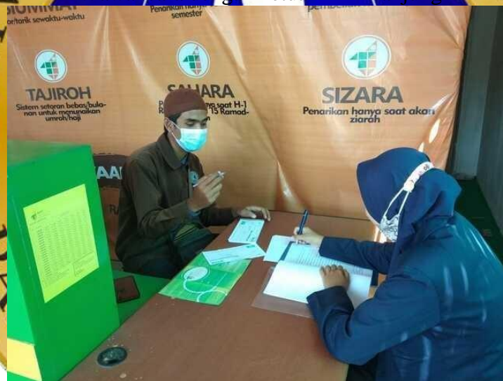
Gambar 2 Bagian Pembiayaan