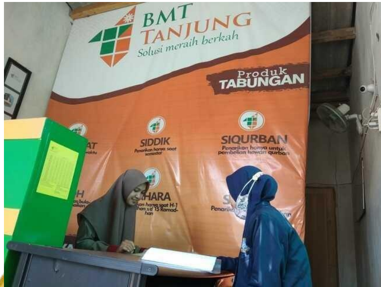
Gambar 3 Bagian Administrasi