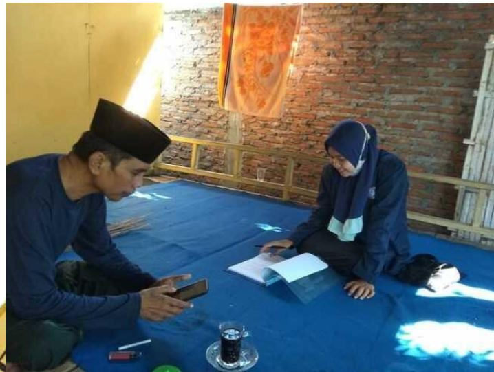
Gambar 1 Wawancara dengan ketua BMT Tanjung