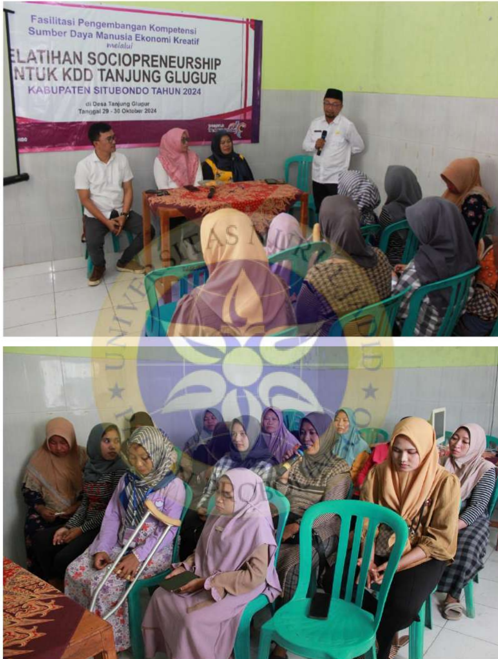
Observasi Pelatihan di Desa Tanjung Glugur