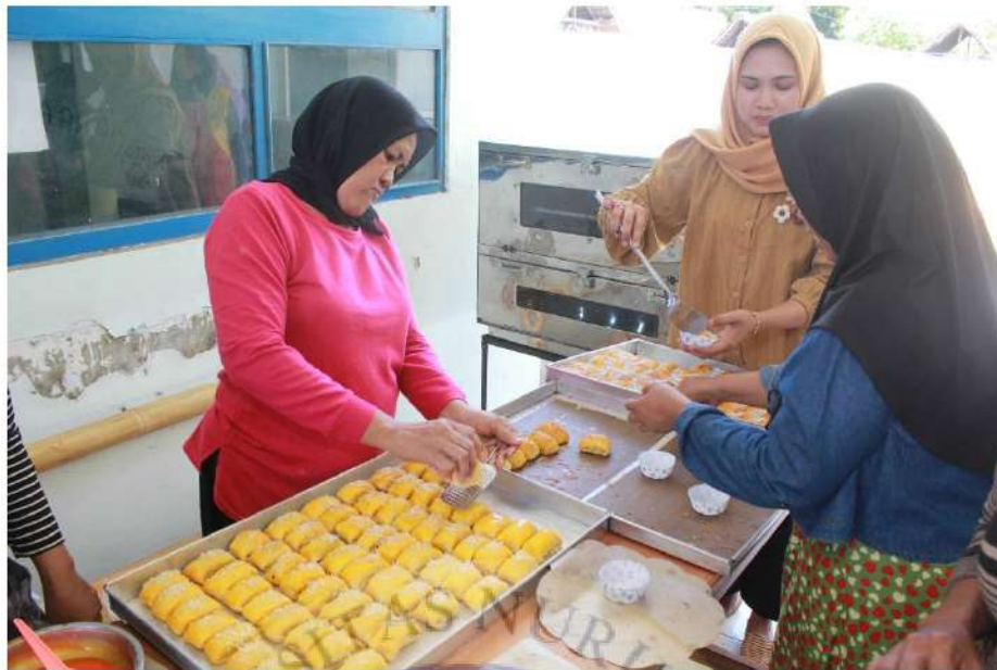
Pelaksanaan dalam Pembuatan Keripik Tempe pada Hari Pertama dan Kue Bolen Hari Kedua