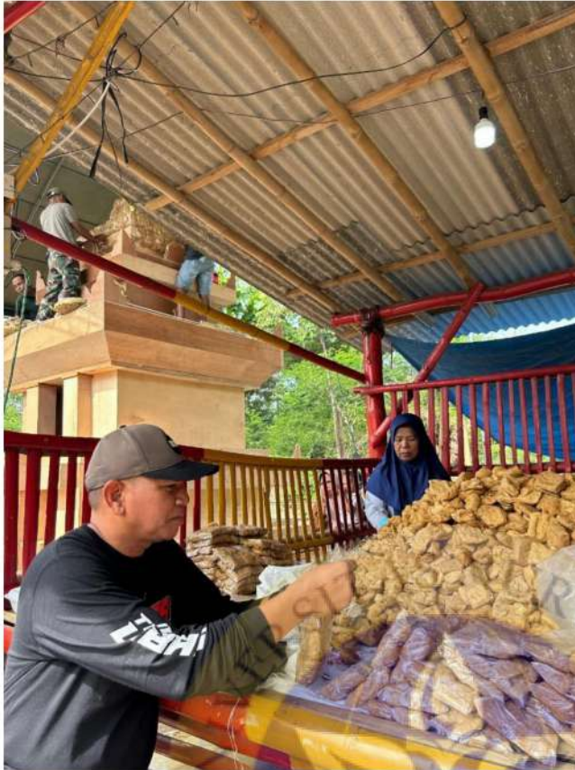
5. Proses pengemasan tahu kedalam plastik