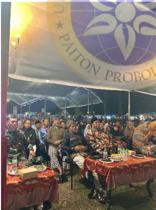
10. Kepala desa beserta jajaranya