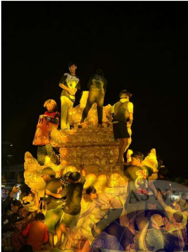
9. Puncak festival masyarakat berebut tumpeng ageng tahu