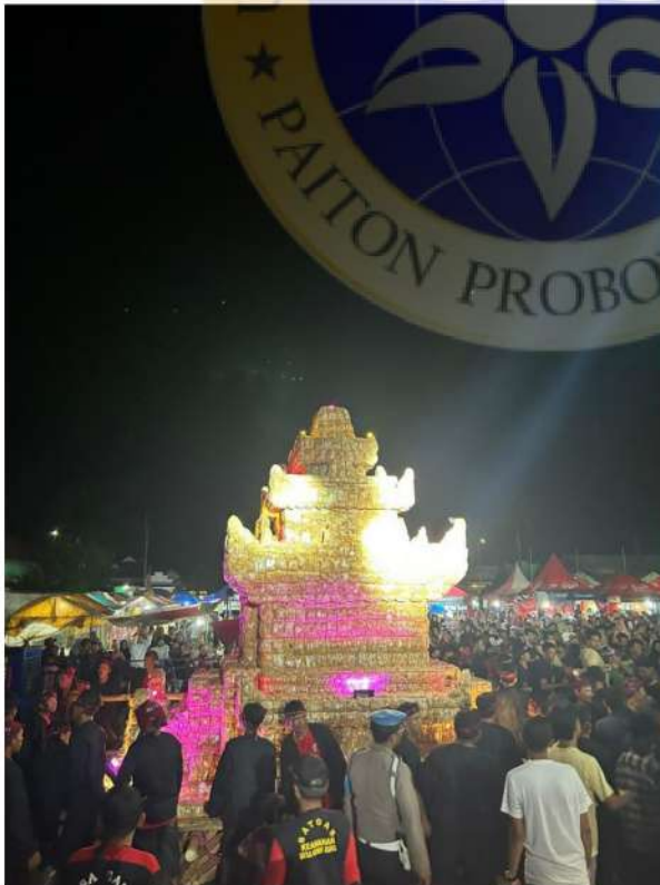
8. Tumpeng ageng tahu siap diarak-arak