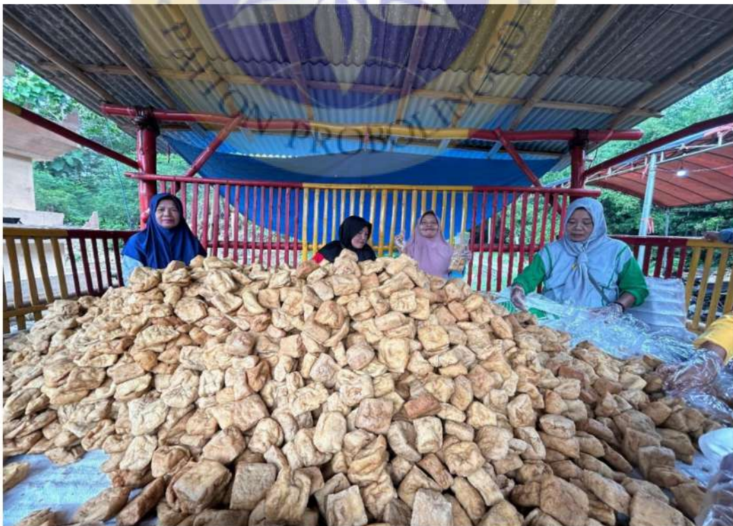
4. Proses tahu yang sudah digoreng