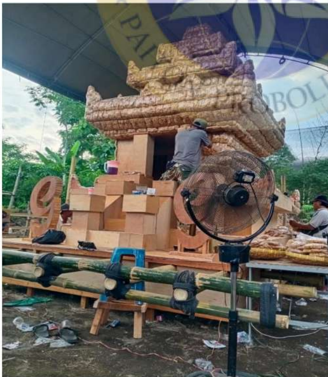
6. Rancangan tumpeng ageng berbentuk candi