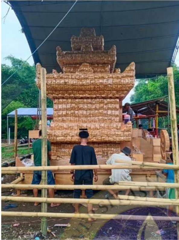
7. Proses perakitan tahu kedalam tumpeng ageng berbentuk candi