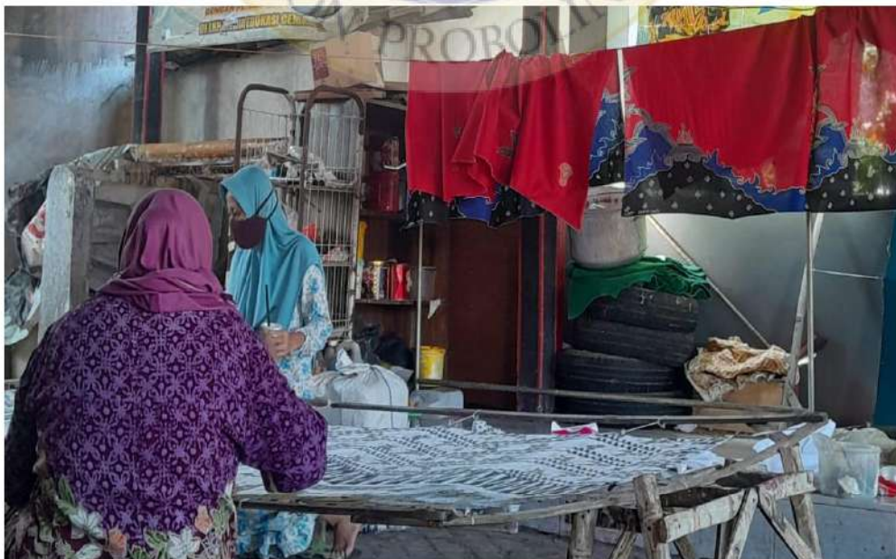
Dokumentasi Proses Mewarnai