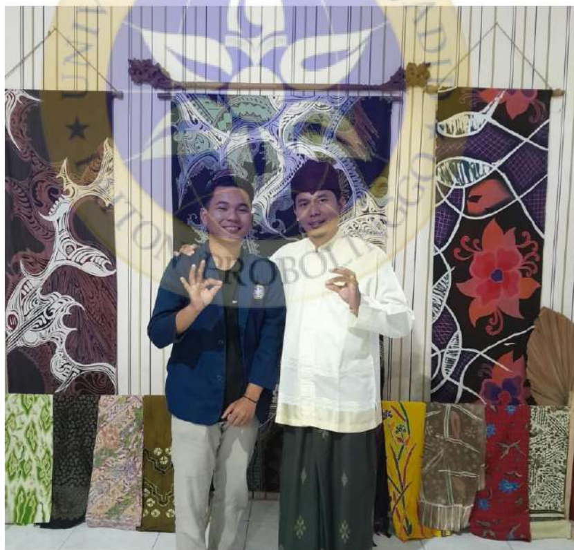
Wawancara dengan owner Batik Tulis Ronggo Mukti