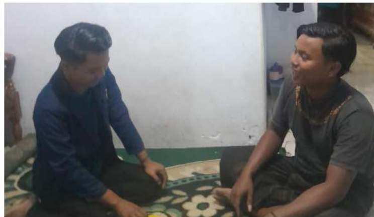
Wawancara dengan informan