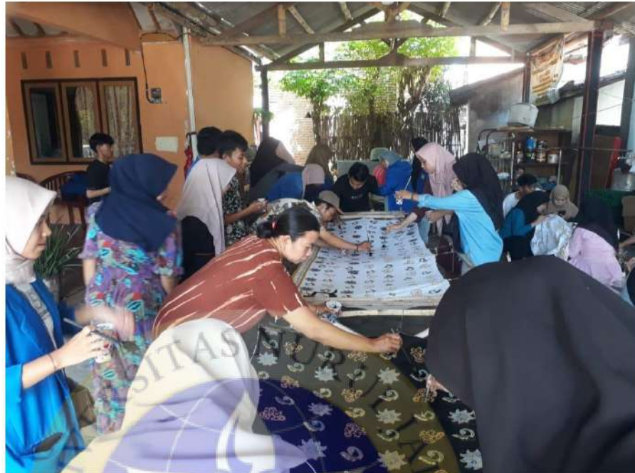
Dokumentasi Mahasiswa Unzah melakukan pelatihan Membatik