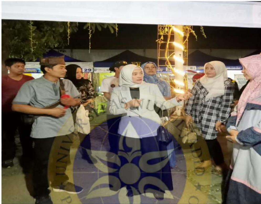
Dokumentasi Pejabat Pemkab melakukan pembelian di pameran Batik pada acara Festival Wisuda Unuja