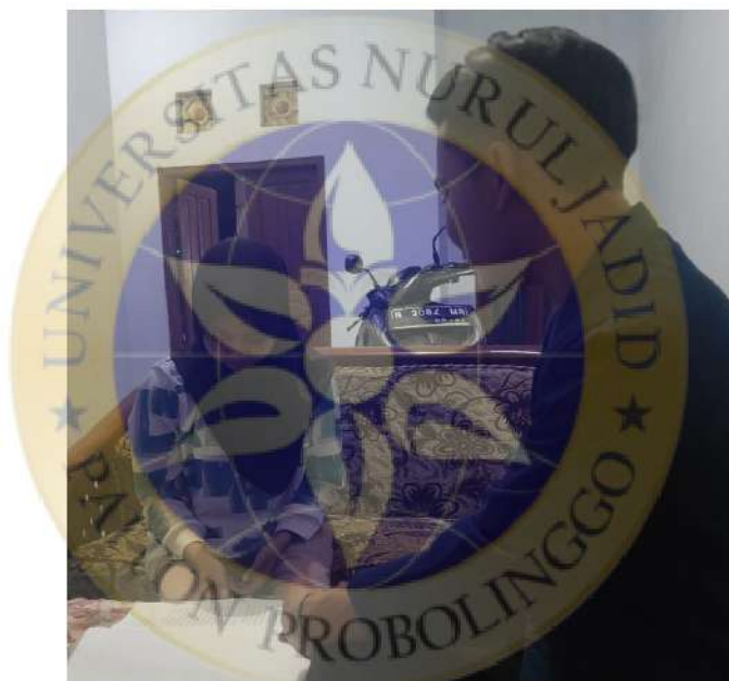
Wawancara dengan informan