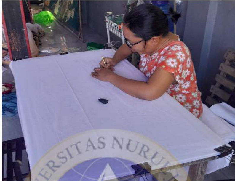
Proses Membuat Desain Atau Motif