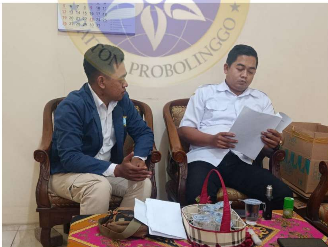
Gambar 4 wawancara dengan staf Bidang Usaha Mikro