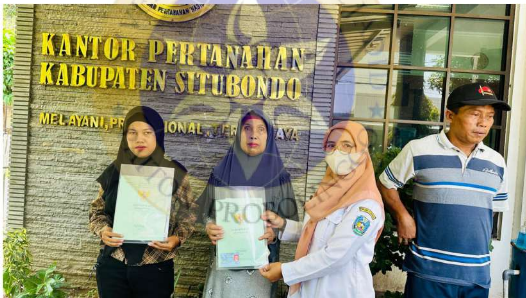
Gambar 12 kegiatan pendampingan penyerahan sertifikat tanah pelaku UMKM