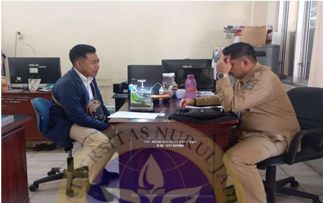
Gambar 1 Wawancara dengan kepala Diskoperindag