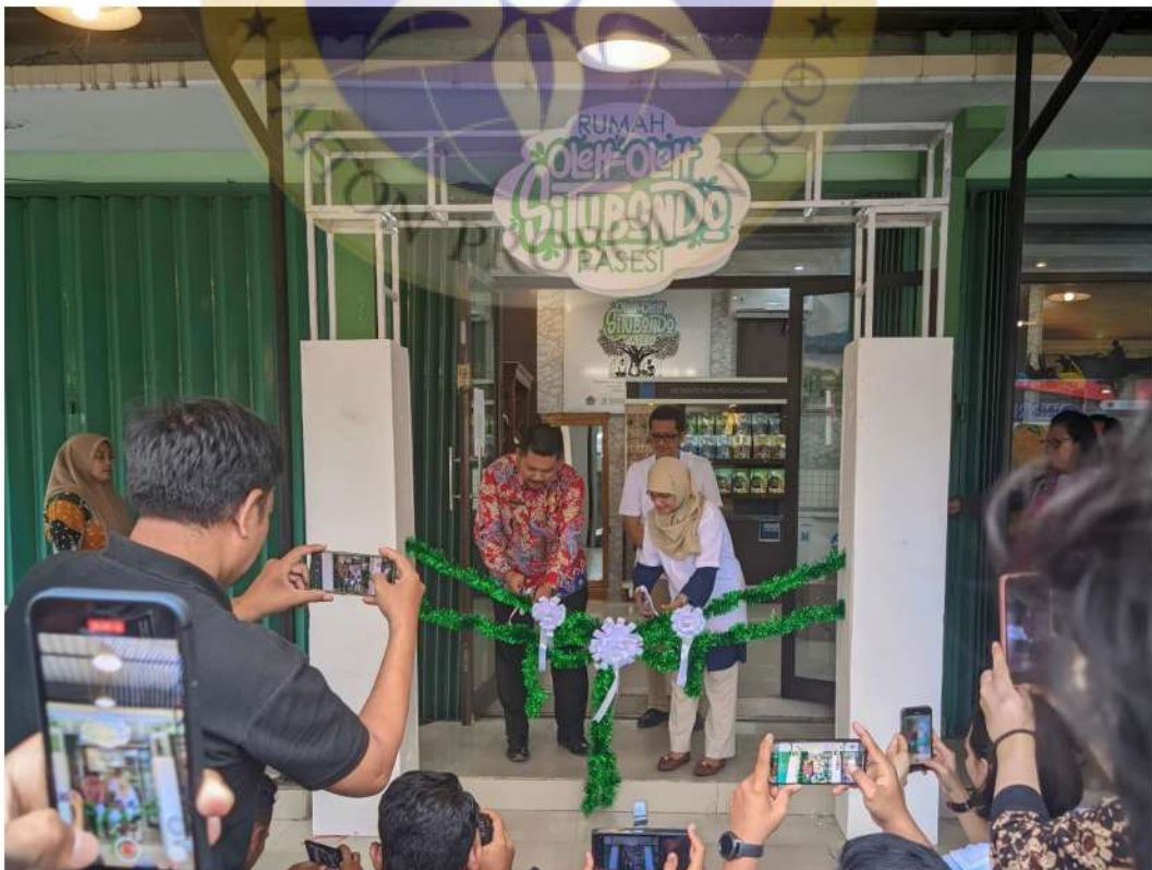
Gambar 10 kegiatan peresmian rumah oleh oleh Situbondo