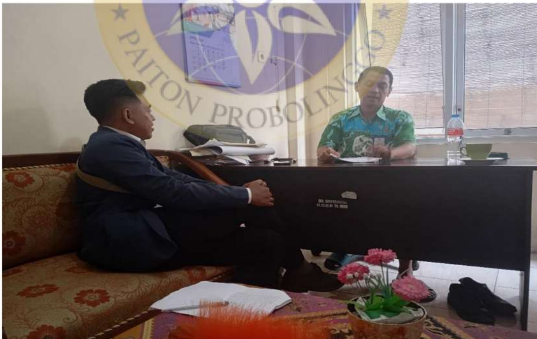
Gambar 2 wawancara dengan Kepala Bidang Usaha Mikro