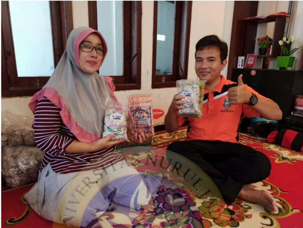
Gambar 13 Pendampingan UMKM oleh bidang Usaha Mikro