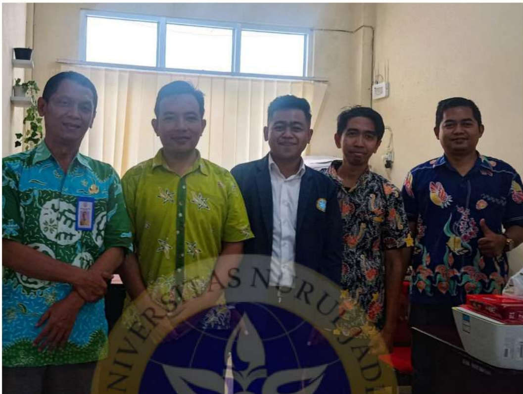
Gambar 5 dokumentasi selesai wawancara di Diskoperindag