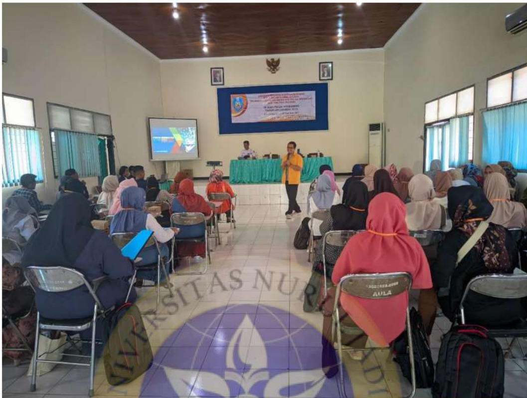
Gambar 7 kegiatan Pelatihan Digital Branding Dan Digital Marketing