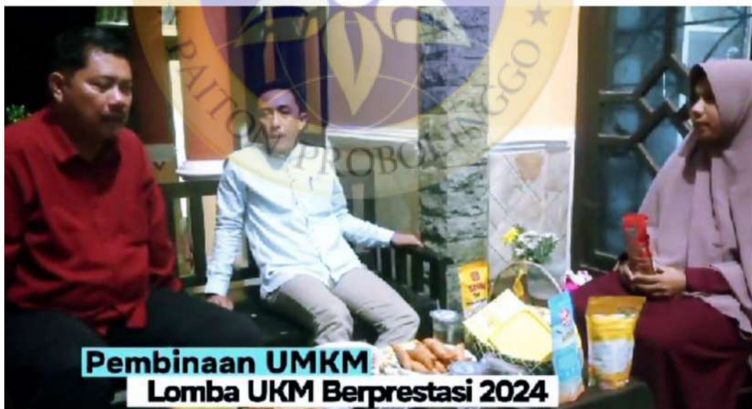
Gambar 14 Pembinaan UMKM oleh diskoperindag Kabupaten Situbondo