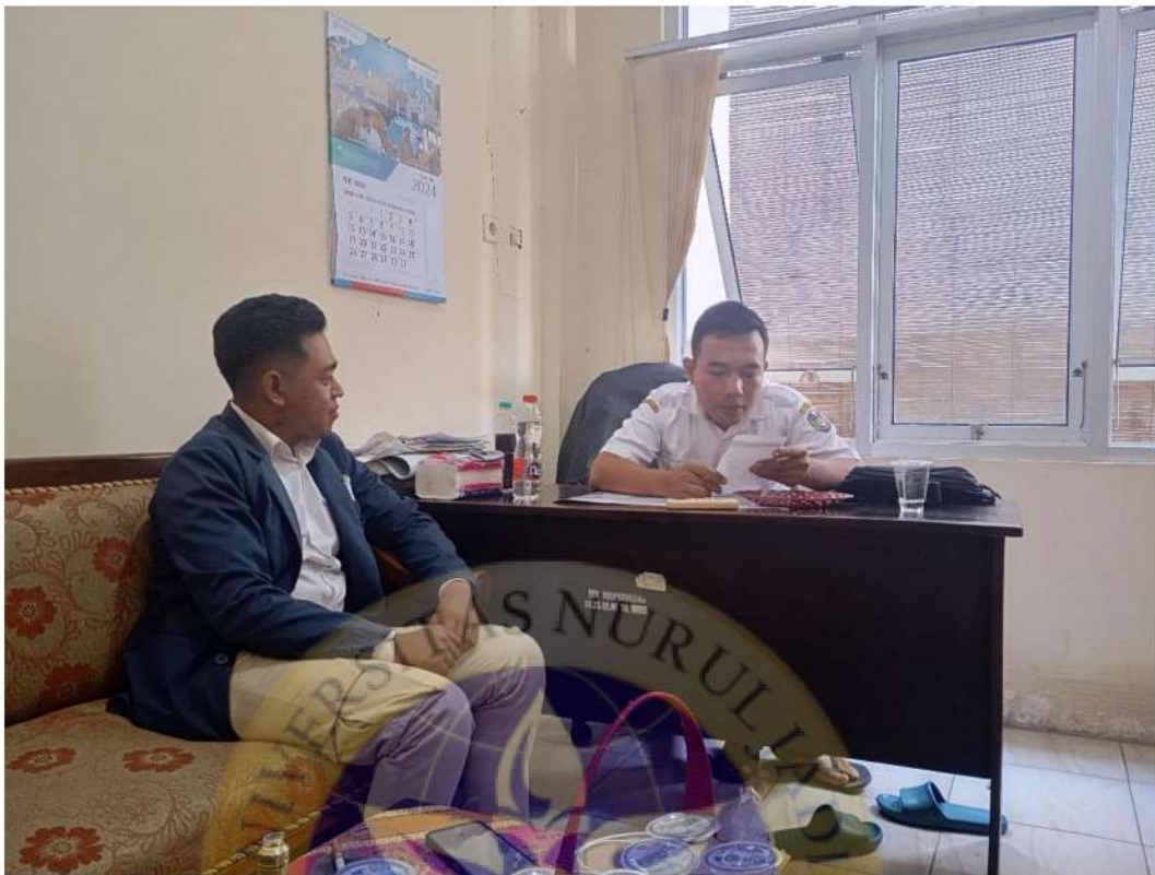
Gambar 3 wawancara dengan staf Bidang Usaha Mikro