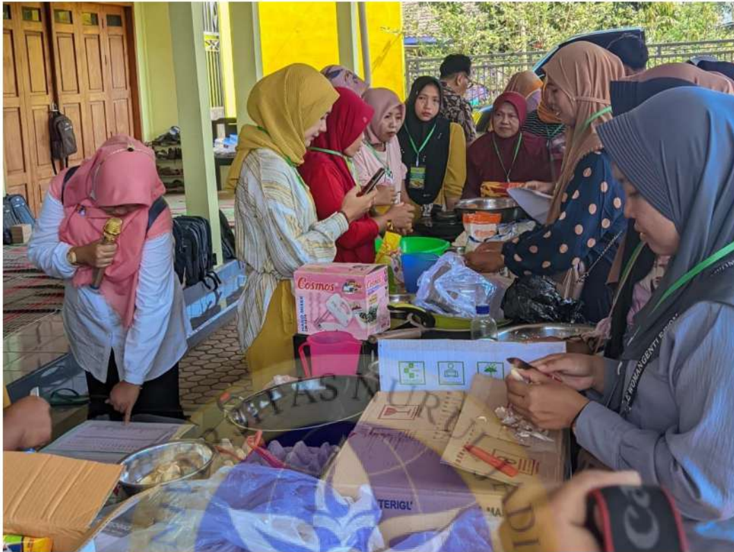
Gambar 9 kegiatan pelatihan olahan jajanan tradisional pelaku UMKM