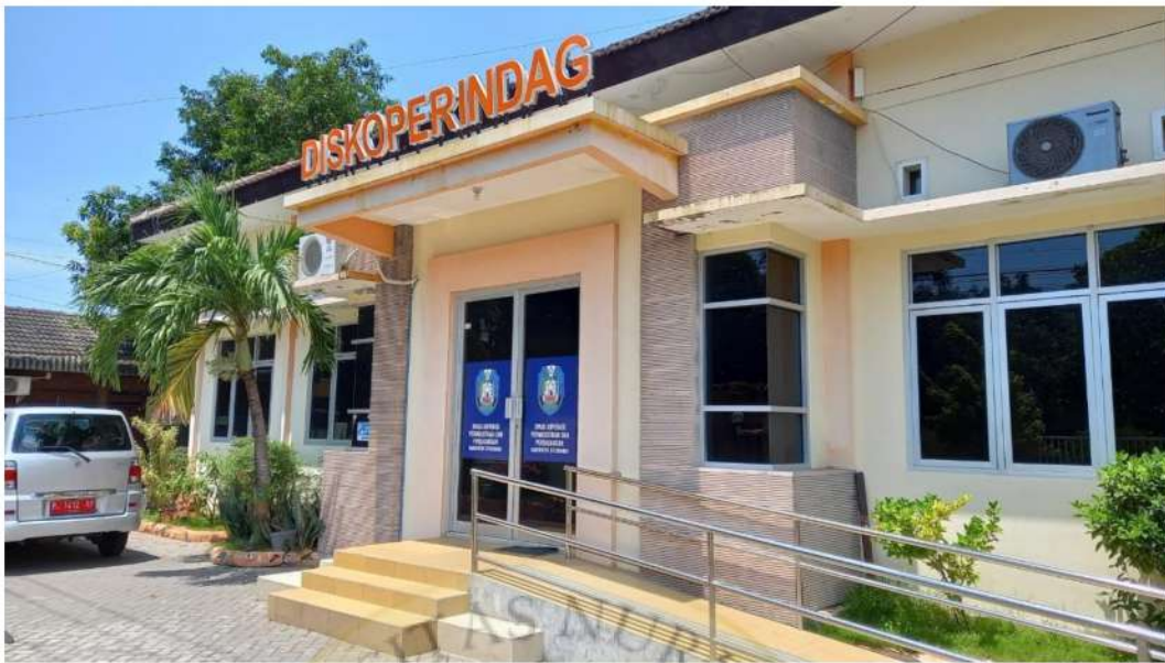
Gambar 15 Kantor Dinas Koperasi Perindustrian Dan Perdagangan Kab. Situbondo