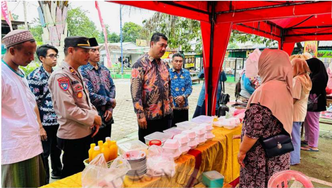
Gambar 11 kegiatan pengadaan pameran untuk pelaku UMKM