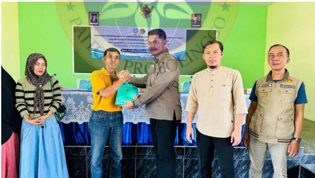
Gambar 6 kegiatan pendampingan penyerahan sertifikat tanah pelaku UMKM