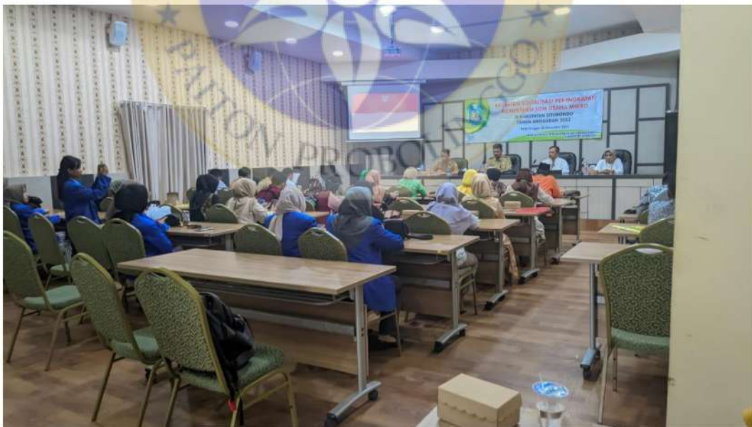
Gambar 8 kegiatan sosialisasi peningkatan kopetensi SDM usaha mikro