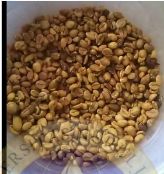
Biji kopi sebelum di sangrai