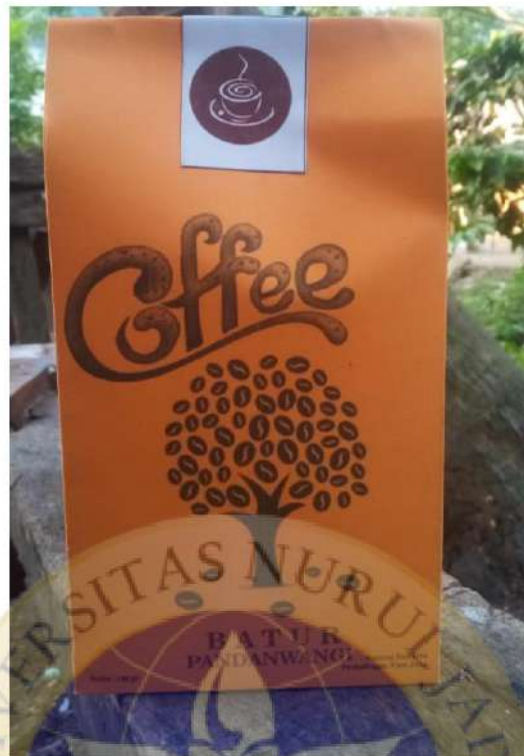
Kopi dalam kemasan