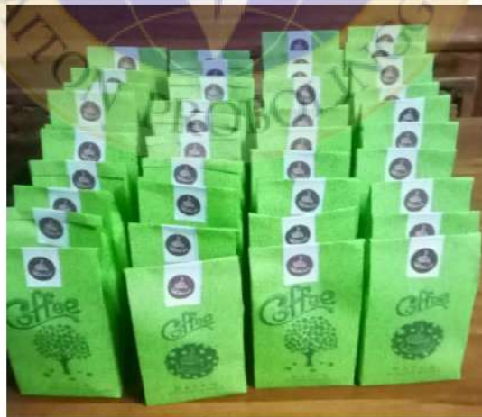
Kopi dalam kemasan