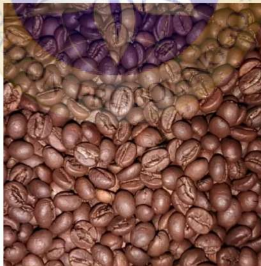
Biji Kopi setelah di sangrai