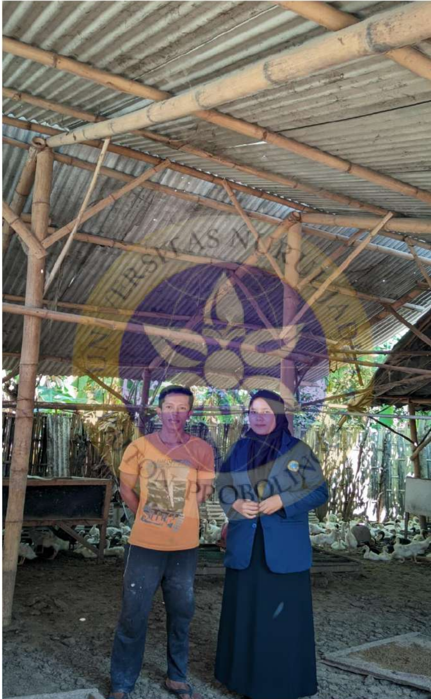
Gambar 4 dokumentasi bersama karyawan usaha ternak bebek