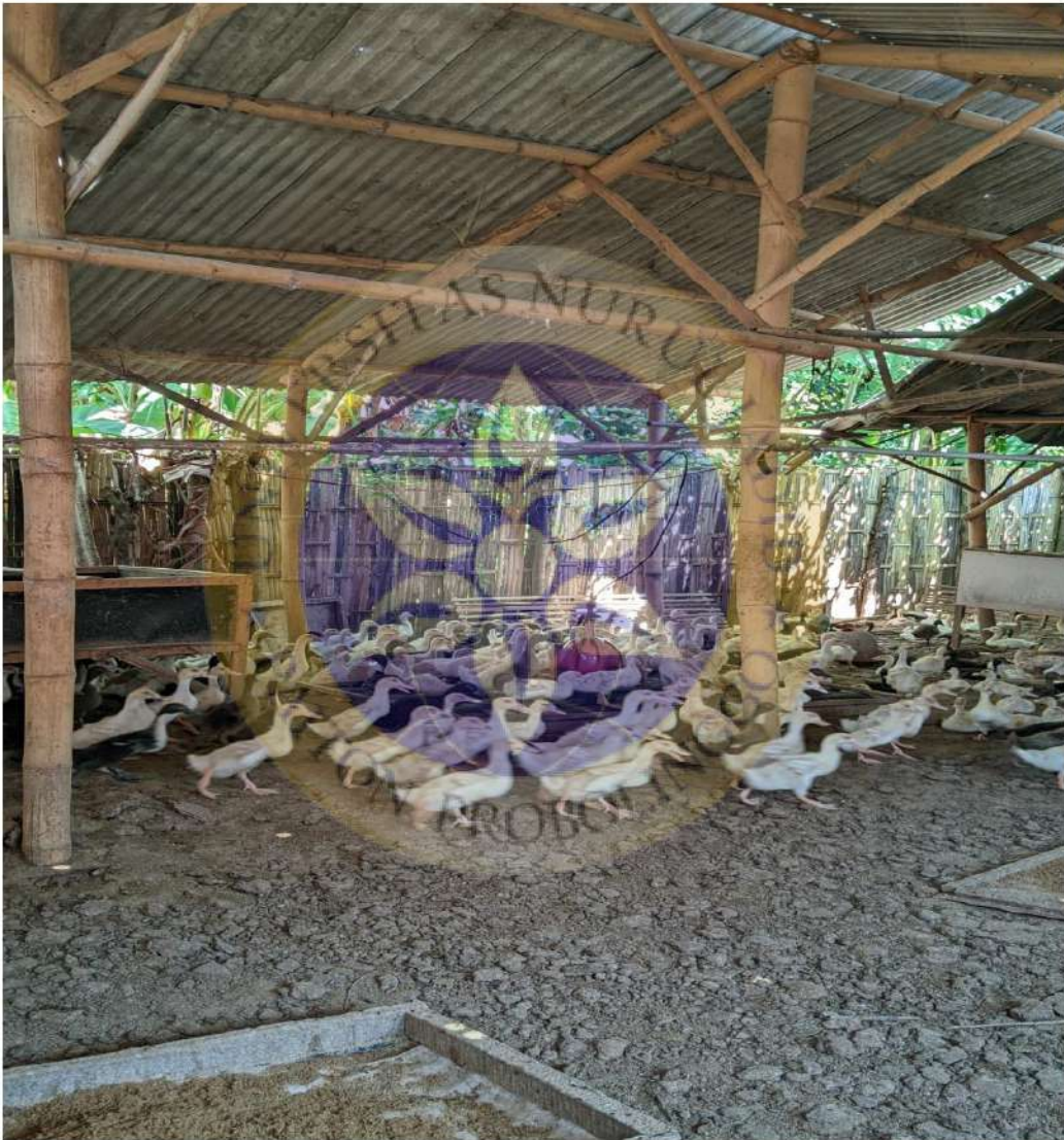
Gambar 1 Lokasi usaha ternak bebek