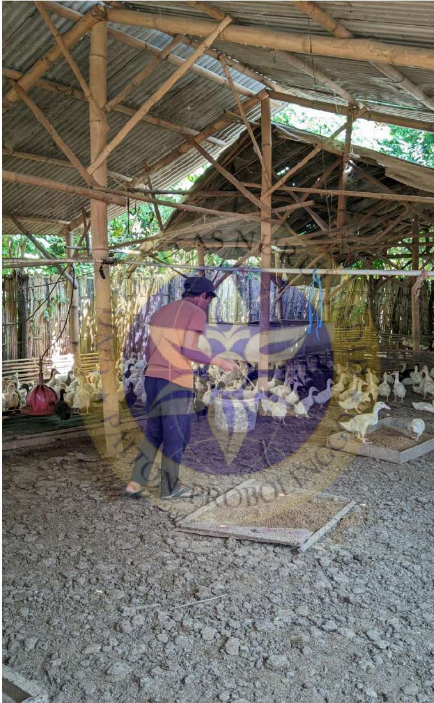
Gambar 5 kegiatan karyawan memberi pakan ke bebek