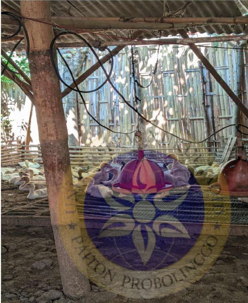
Gambar 7 alat teknologi untuk memberi minum kepada bebek