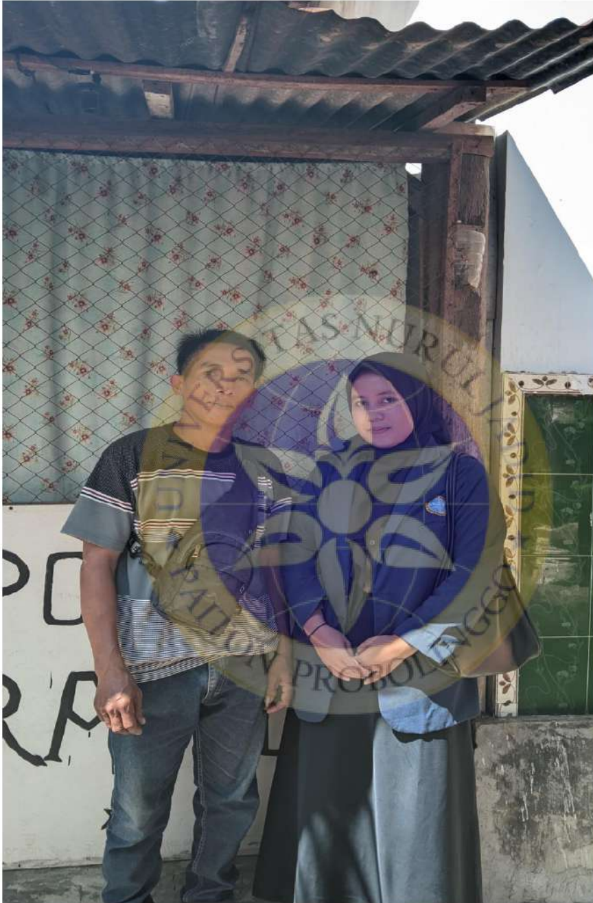
Gambar 8 dokumentasi bersama customer bebek