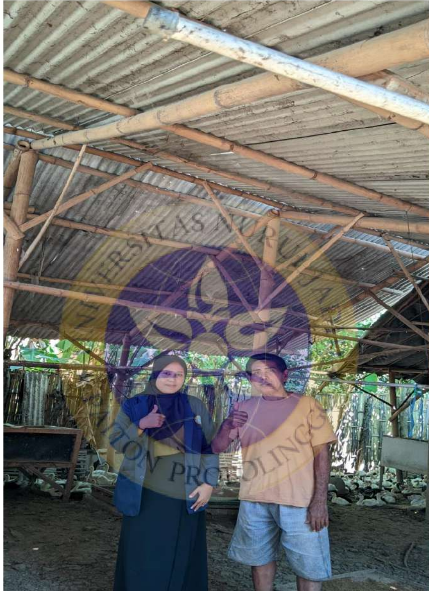
Gambar 3 Dokumentasi bersama pemilik usaha ternak bebek ketika selesai wawancara