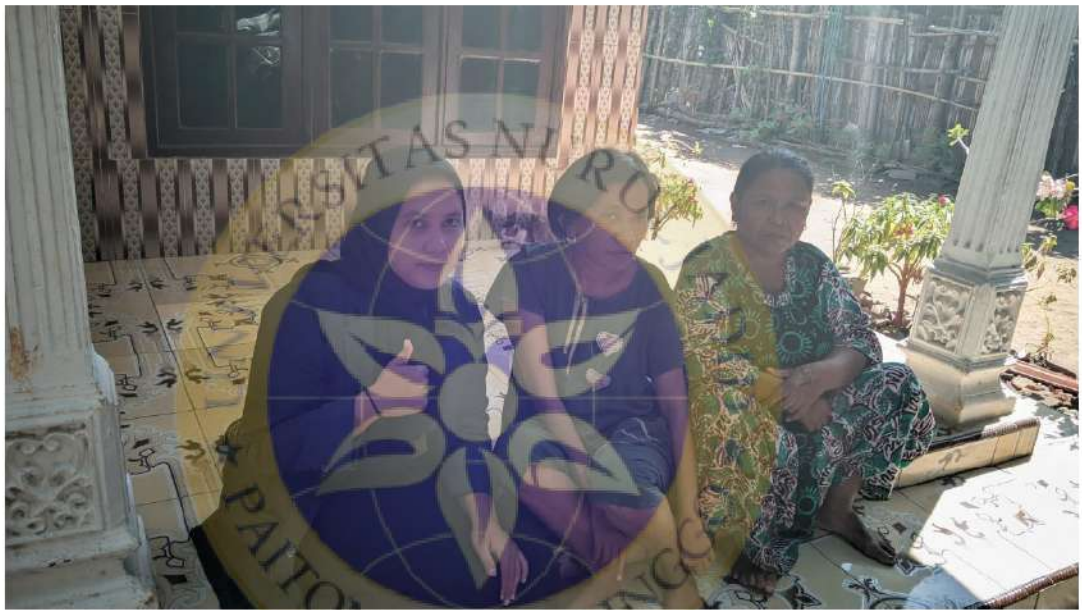
Gambar 6 wawancara bersama dengan warga