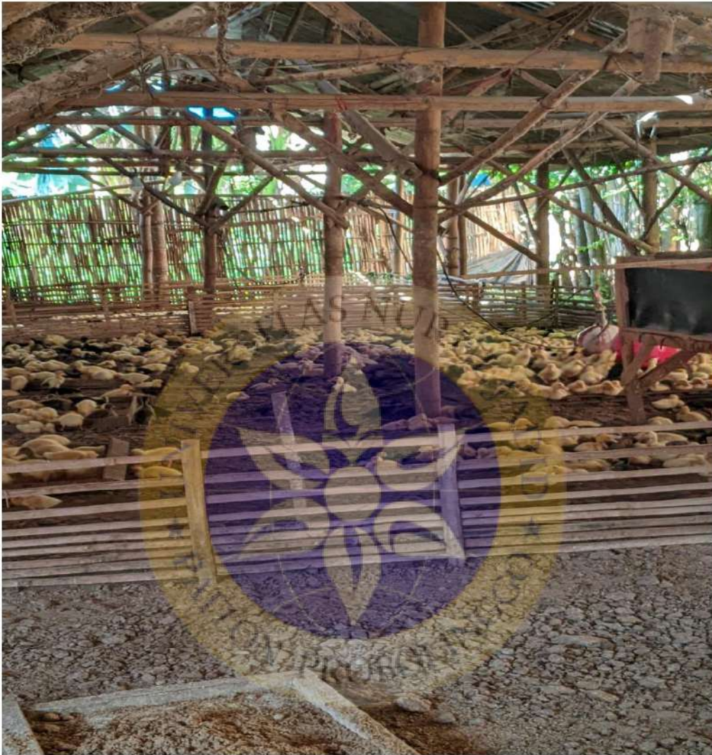
Gambar 2 Lokasi usaha ternak bebek