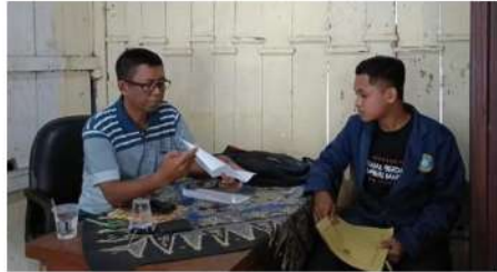
Dokumentasi dengan kepala pasar