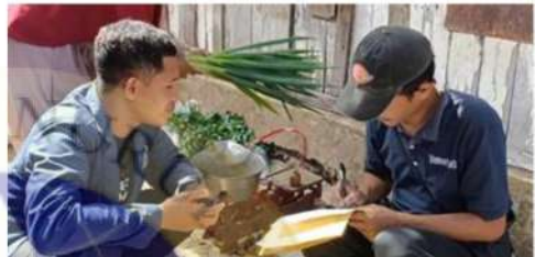
Dokumentasi dengan pedagang