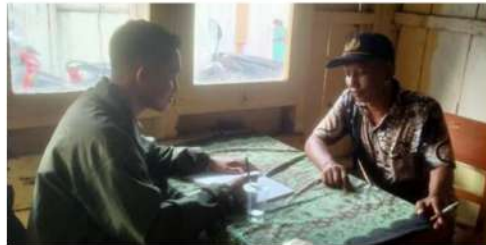
Dokumentasi dengan staff pasar