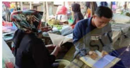
Dokumentasi dengan pedagang